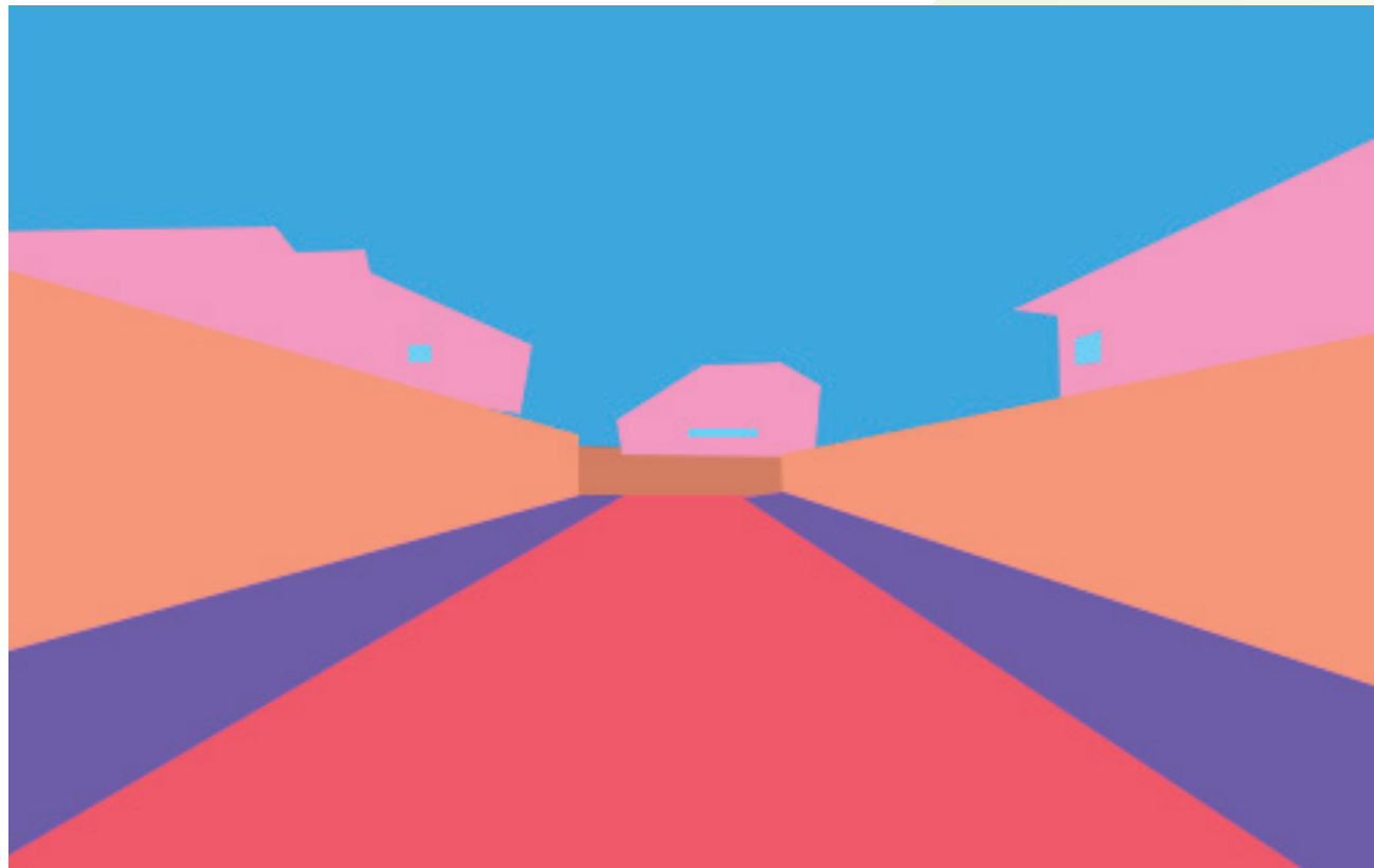
IMAGEM DA CIDADE A imagem da cidade deve ornar com a tipologia que está inserida. O impacto sobre o desenho urbano está ligada ao seu dimensionamento e no que é permitido construir .