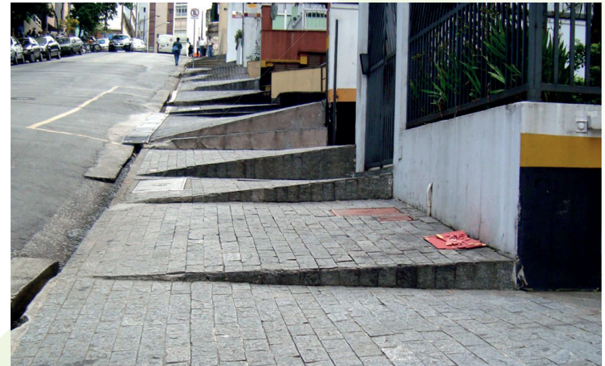
São Paulo SP

Calçadas e ambientes bem planejados e acessíveis proporcionam o direito de ir e vir de pessoas com mobilidade reduzida .