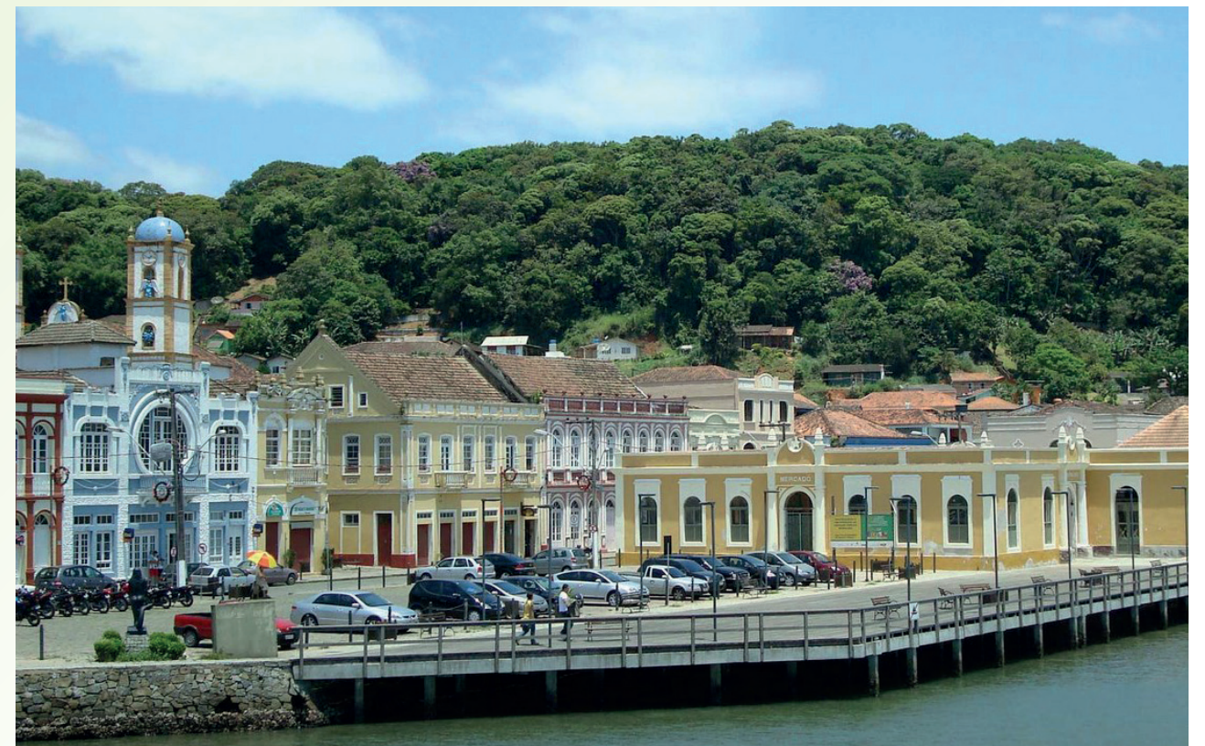
São Francisco do Sul - SC