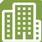
IMAGEM DA CIDADE