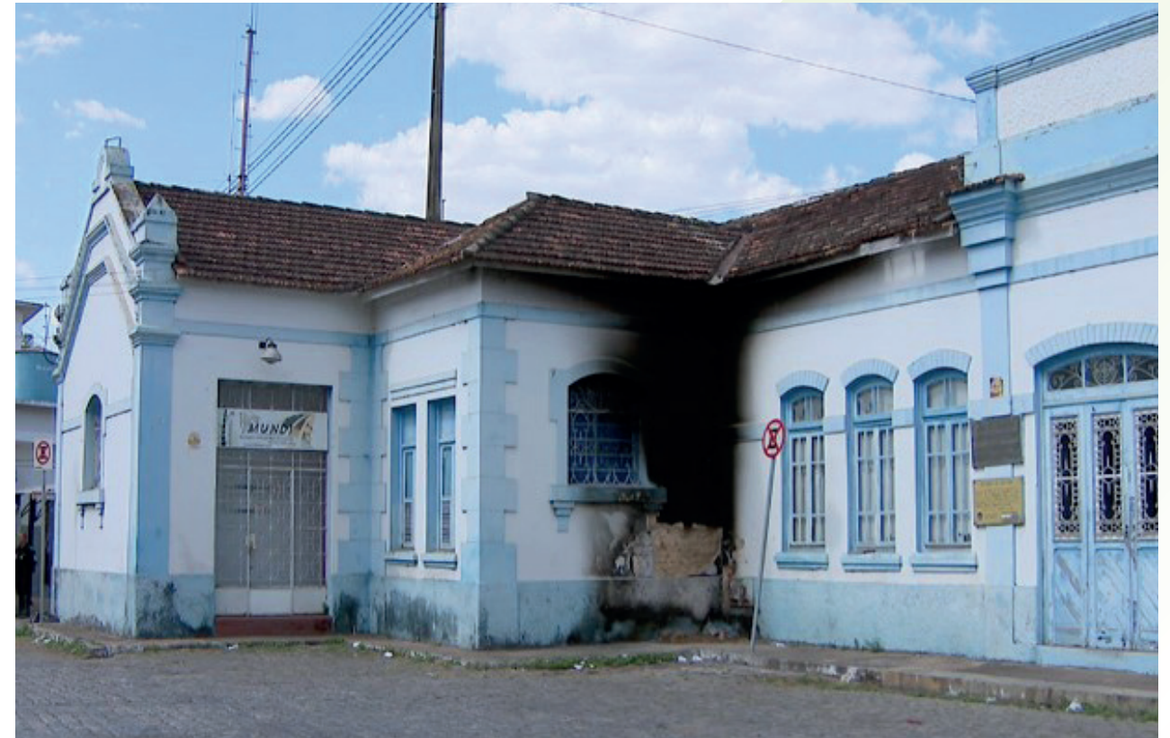
Divinópolis - MG

Preservar a fachada e dar NOVOS USOS para edificações históricas mantém viva a identidade do local, podendo ser um forte atrativo turístico ;